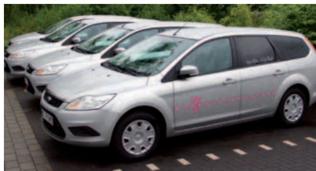
Der durchschnittliche reale CO 2 -Emissionswert der Pkw in der Magenta-Flotte lag im Jahr 2009 bei 187,5 g/km.

Die Deutsche Telekom hatte sich im Rahmen ihres Nachhaltigkeitsprogramms verpflichtet, bei der Beschaf-