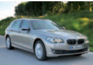
Bislang Aufsteiger des Jahres: die BMW 5er-Reihe

Beindruckend fällt dagegen nach den ersten beiden Monaten die Performance von Volvo aus. Mit einem Plus von fast 70 Prozent bewegen sich die Schweden im „sattgrünen“ Bereich und liegen in der Gesamtstatistik der Importeure hinter Skoda und Renault auf Rang drei.