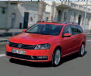
Das Flottenauto in Deutschland: der VW Passat Variant