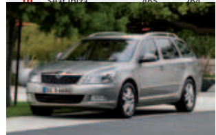
Das Flottenauto bei den Importeuren: der Skoda Octavia

einem Marktanteil von 21,19 Prozent. Rechnet man die 1.251 Einheiten von Seat (plus 61,63 Prozent) hinzu, kommen die beiden VW-Töchter innerhalb der Importeursriege nach den ersten beiden Monaten des Jahres auf einen Marktanteil von 26,17 Prozent. Oder anders ausgedrückt: Mehr als jedes vierte bis Ende Februar 2011 neu zugelassene Importeursauto im Flottenbereich war ein Modell von Skoda oder Seat.