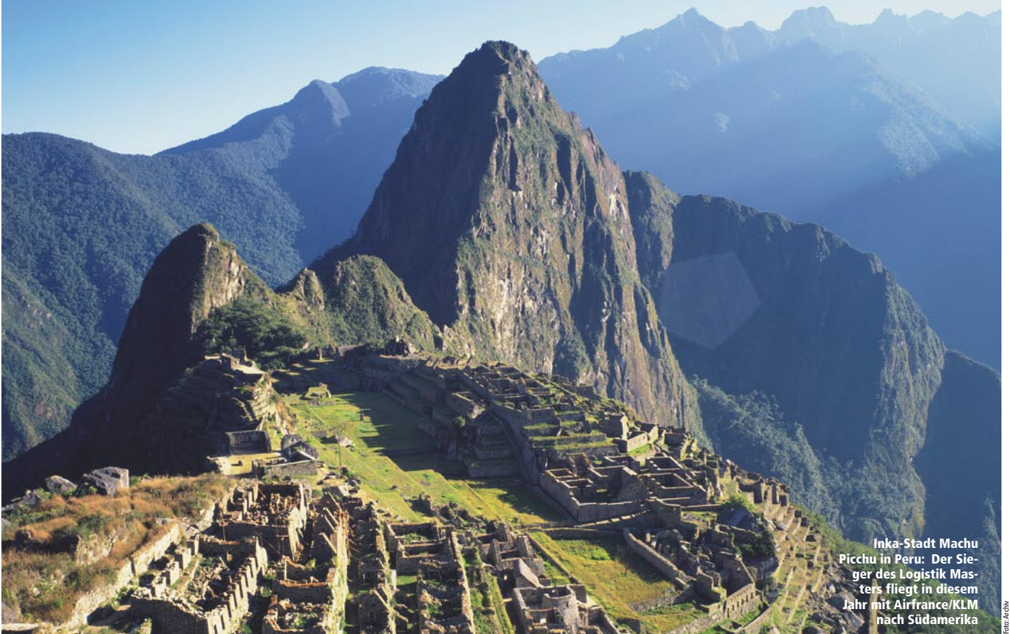
Inka-Stadt Machu Picchu in Peru: Der Sieger des Logistik Masters fliegt in diesem Jahr mit Airfrance/KLM nach Südamerika

➔ Das gab es noch nie: Die drei Gewinner des größten deutschen Wissenswettbewerbs für Logistikstudenten kommen in diesem Jahr alle von der Fachhochschule Münster.