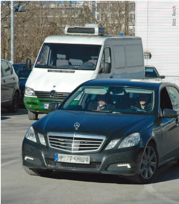
Zu Beginn jeder HU steht eine Mini-Probefahrt mit der Prüfung elektronischer Systeme an.

✓ Wie bisher können die Werkstätten einen HU-Vorabcheck an Kundenfahrzeugen durchführen. Dabei können sie alle für das Bestehen der HU relevanten Punkte prüfen, also auch auf die elektronischen Systeme zugreifen und so entdeckte Mängel vor der Durchführung der HU durch einen Prüfer beheben.