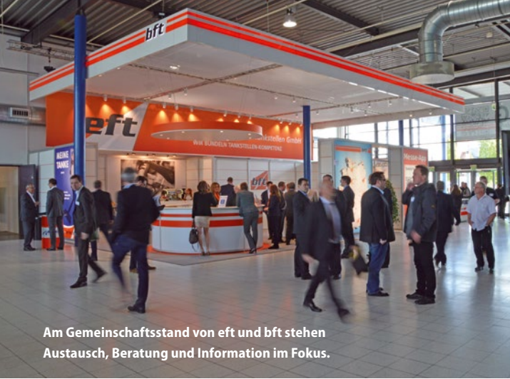
Am Gemeinschaftsstand von eft und bft stehen Austausch, Beratung und Information im Fokus.