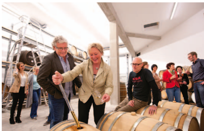
Mit dem Whisky auf Du und Du bei einer Besichtigung der Birkenhof-Brennerei

Wie entsteht ein Destillat? Welche Aromen entstehen beim Einmaischen verschiedener Getreide- und Obstsorten? Welches Klima braucht ein Whisky, um zu reifen? Wie kann man Brände und Lebensmittel kombinieren? Bei den Führungen gibt das Team der Birkenhof-Brennerei gerne Einblick in die Welt edler Destillate. Für Gruppen besonders attraktiv sind die Genuss-Abende in der Westerwälder Edeldestillerie: Nach einer kurzen, informativen Besichtigung und einem Riechparcours werden schöne Dinge aus dem Feinkostbereich aufgetischt. Man verkostet in geselliger