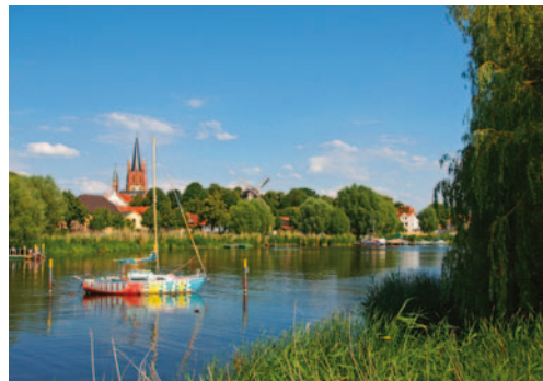
Im Winter ebenso wie im Sommer lohnt sich ein Besuch in Brandenburg – im Spreewald oder an der Havel