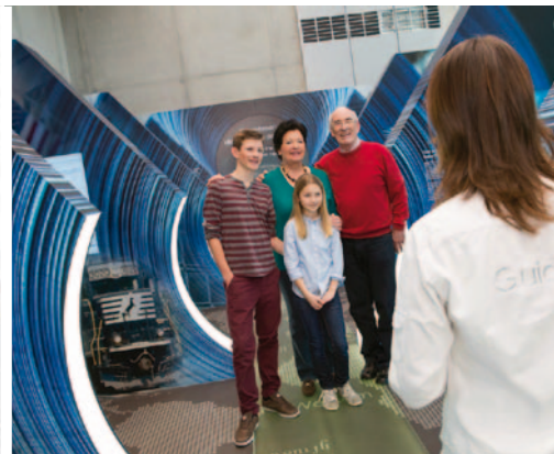
Gemeinsame Erlebnisse stärken den Zusammenhalt der Mitglieder – zum Beispiel im Freizeitpark Belantis, beim Rafting im Ötztal oder in der voestalpine Stahlwelt