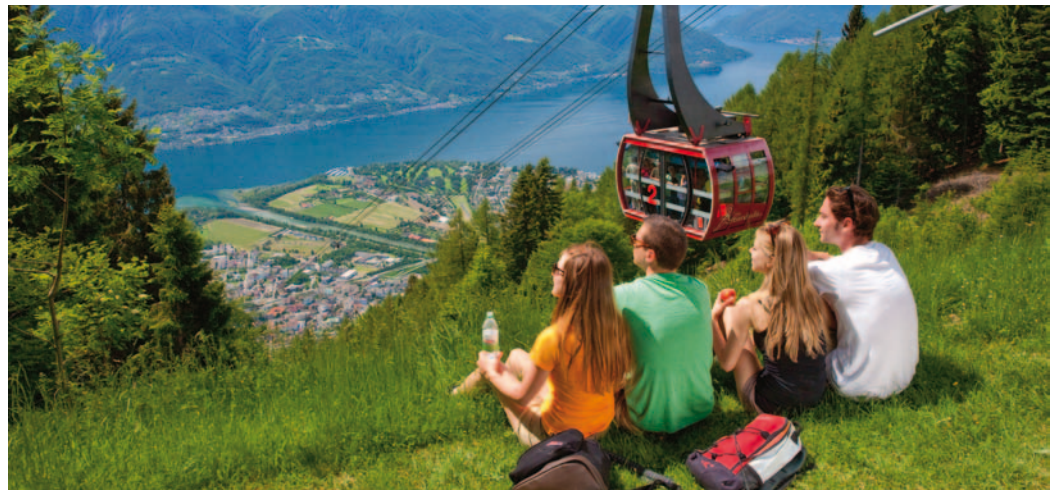
Im Tessin kann man den höchsten und den tiefsten Punkt der Schweiz entdecken

Wer hätte gedacht, dass es einen bequem erreichbaren Aussichtspunkt gibt, von dem gleichzeitig der tiefste Punkt (Lago Maggiore) und der höchste Punkt (Dufourspitze des Monte Rosa) der Schweiz zu sehen sind? Mit der modernen Luftseilbahn gelangt man in wenigen Minuten von Orselina nach Cardada auf 1.340 Metern Höhe, und weiter mit dem