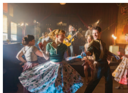
Das Wunder von Bern: Fußball und Familie