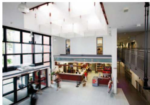
Helle, moderne Zimmer und gepflegte Gemeinschaftsbereiche bieten die rheinischen Jugendherbergen