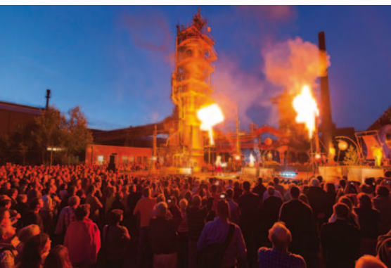
Spannende Inszenierungen bei der „ExtraSchicht“

Ganz besonders werden diese Denkmäler in der Nacht der Industriekultur gefeiert. Am 25. Juni 2016 ist es wieder soweit! Wenn atemberaubende Industriekulissen zu Bühnen für spektakuläre Inszenierungen werden, dann ist ExtraSchicht,