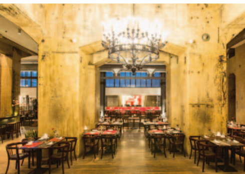
Ungewöhnlich genießen im Casino Zollverein

www.casino-zollverein.de , Tel.: 0201 830240