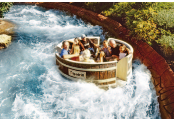
Wilder Wasserspaß beim Waschuber Rafting

Das Wildparadies mit Abenteuerspielplatz, Walderlebnis-Pfad und Barfuß-Pfad ist im Eintritt für den Erlebnispark enthalten. Wissenswertes erfährt man während der Fütterung von Wolf, Bär & Co. und der Greifvogel-Flugvorführung auf der Falknertribüne (täglich außer freitags). Einmalige Übernachtungsmöglichkeiten bietet das Natur-Resort direkt vor dem Wildparadies