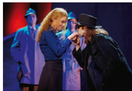
Hinterm Horizont: Bewegende Ost-West-Geschichte