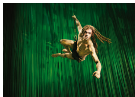
Tarzan: Musikalische Dschungelwelt