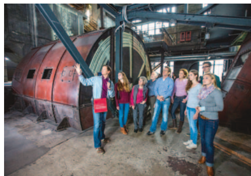
Führung durch den Denkmalpfad Zollverein